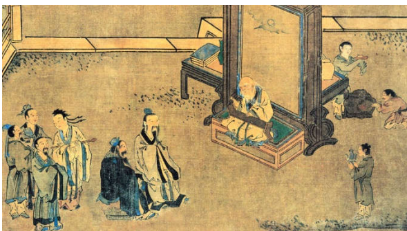
ขงจื้อ (Confucius : 孔子)

รายงานฉบับนี้จัดทำขึ้นโดยข้อมูลเท่าที่ปรากฏและเชื่อว่าเป็นที่น่าเชื่อถือได้แต่ไม่ถือเป็นการยืนยันความถูกต้องและความสมบูรณ์ของข้อมูลใดๆ โดยบริษัทหลักทรัพย์ ยูเอสบี เคย์ เฮียน (ประเทศไทย) จำกัด (มหาชน) ผู้จัดทำของสงวนสิทธิ์ในการเปลี่ยนแปลงความเห็นหรือประมาณการณ้ต่างที่ปรากฏในรายงานฉบับนี้ โดยไม่ต้องแจ้งล่วงหน้า รายงานฉบับนี้มีวัตถุประสงค์เพื่อใช้ประกอบการตัดสินใจของนักลงทุน โดยไม่ได้เป็นการชี้นำชักชวนให้นักลงทุนทำการซื้อหรือขายหลักทรัพย์ หรือตราสารทางการเงินใดๆ ที่ปรากฏในรายงาน